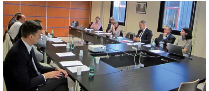
▲ Réunion chez Synapse Construction