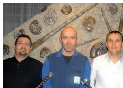
Noël entouré des dirigeants

La société familiale GUILLET basée à Villebois, créée en 1643, est un acteur majeur dans la fabrication d'outils réalisés à 100 % en France pour le travail de la pierre et du béton et pour l'outillage à percussion dans l'industrie.